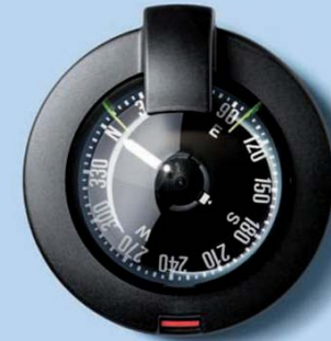
Kreiselkompass Erfinder: Dr. Hermann Anschütz-Kaempfe Deutschland, 1907

Richtungsweisend. Made in Germany. So finden Sie uns in Mainz.